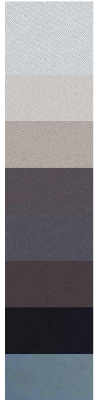
Blanc* 01 Gris 97 Mastic 48 Taupe 95 Acier 18 Chocolat 70 Noir 10 Titanium 98

* Laize 300 cm Disponible également en 150 cm. Le BOREAL est un obscurcissant occultant à 90% en coloris foncé et 60% en coloris clair.