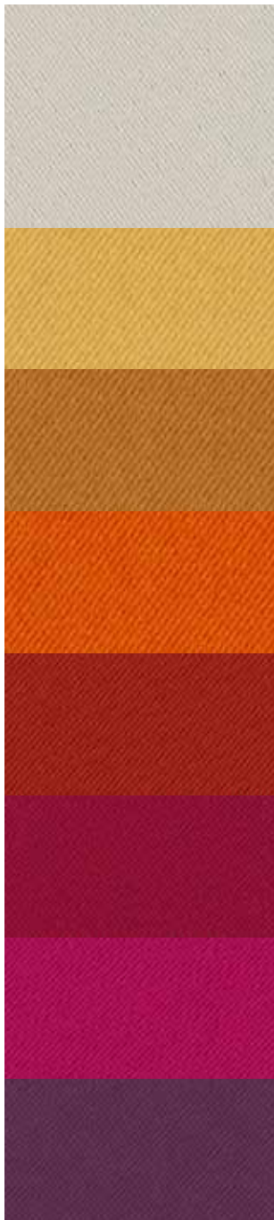
Crème 02 Moutarde 47 Cuivre 50 Orange 15 Terracotta 65 Bordeaux 04 Fuchsia 33 Prune 84